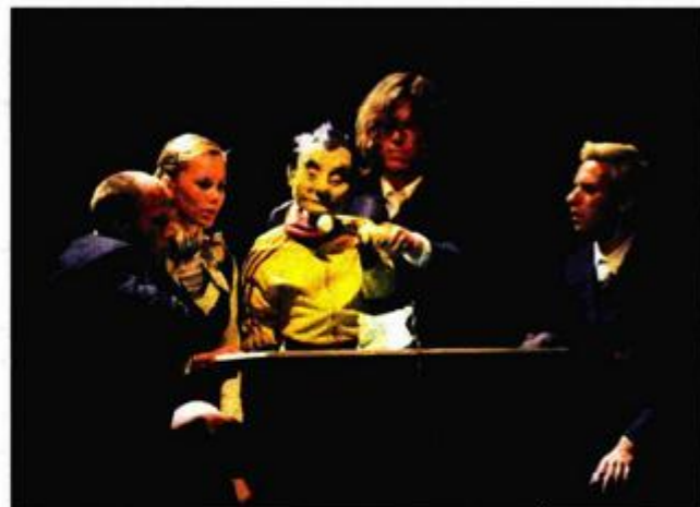
Iz sugestivne norveške plesne predstave