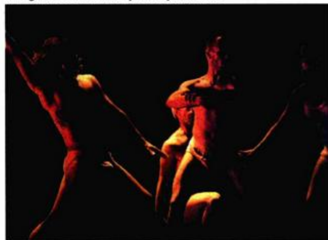
Plesna postava "najvažnijoj sporednoj stvari na svijetu"